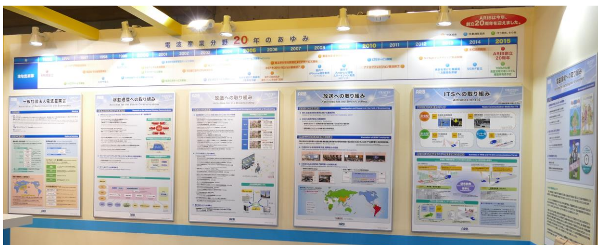
パネル展示による ARIB の紹介

このイベントは最先端の ICT・エレクトロニクス総合展として注目度が高く、本年は 531 社・団体 (2014 年 : 547 社・団体) が参加し、ARIB ブースには約 1000 名の方にご来訪を頂きました。