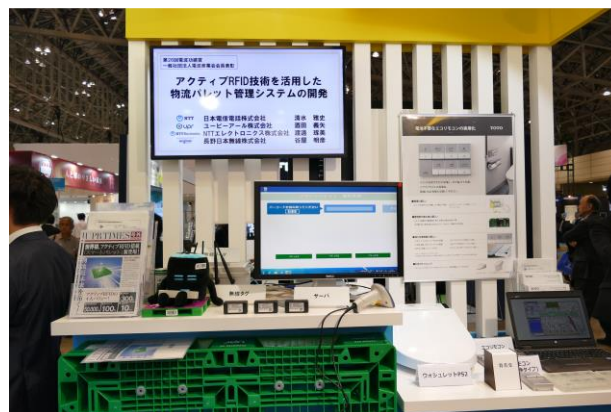
電波功績賞受賞技術のデモ展示