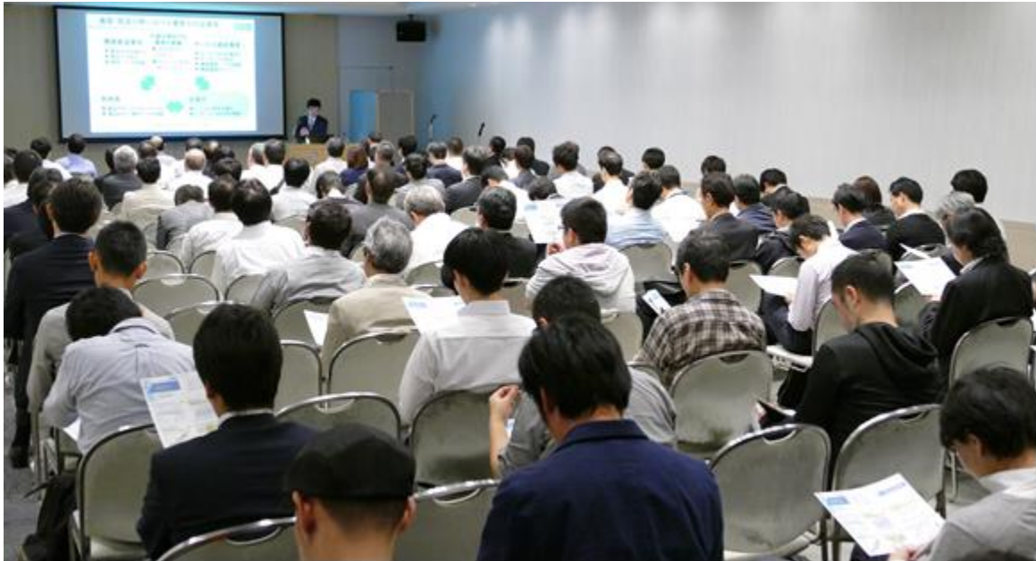
CEATEC JAPAN 2015 ARIB セミナーの様子