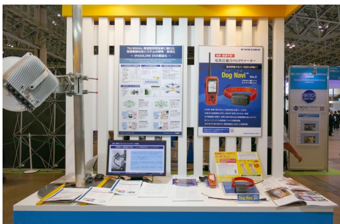
電波功績賞受賞技術のデモ展示