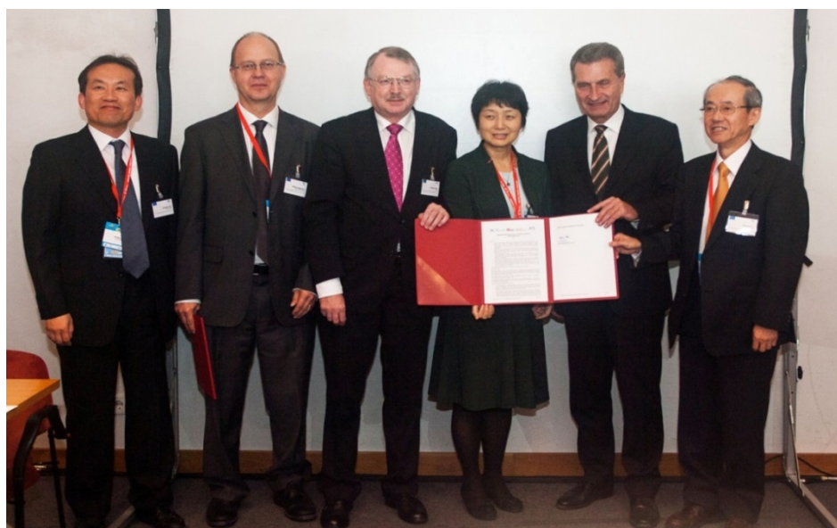
グローバル5Gイベントに関する覚書締結のアナウンス後の記念写真

このワークショップの中で、5つの民間5G推進団体は、5Gのビジョンや要求条件等について情報・意見交換を行う「グローバル5Gイベント」を毎年2回持ち回りで開催することで合意し、5G推進団体間で覚書を締結しました。