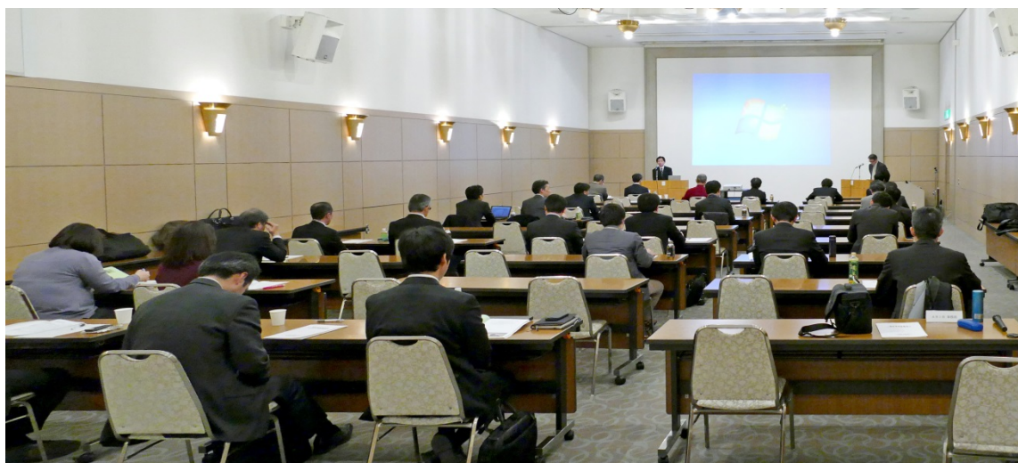
平成 28 年度 会員向け講演会の様子

講演会開催後に意見交換会を開催し、講師と出席者同士で主に電磁環境に関する情報交換が行われました。