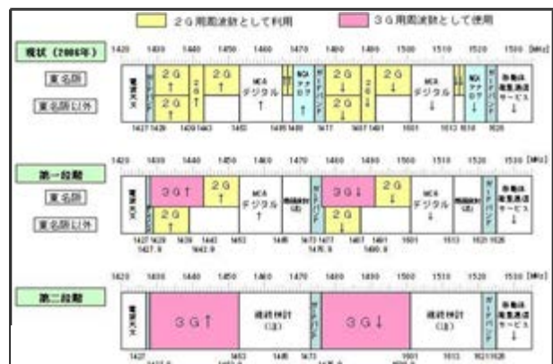
図 1.5GHz帯の再編シナリオ

1.5GHz帯を使用する各無線システム間の所要ガードバンド幅等を算出した結果に基づき、既存の2Gを3Gへ高度化し周波数を有効利用するための各無線システムが使用する周波数配置を検討し、図のように配置することが適当であると結論。