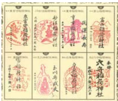
羽田七福いなりめぐり 御集印帳

今年の初詣は大田区の羽田七福いなりめぐりの参拝をして来ました。この羽田 七福いなりめぐりは毎年1月1日～同5日までの5日間（午前9時～午後3 時）に行われる催し物です。