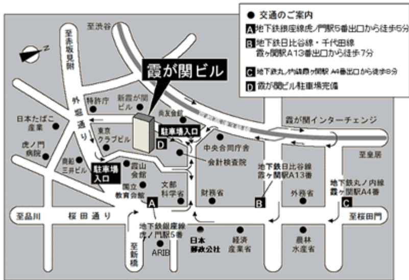
霞が関ビル 33 階 東海大学校友会館 望星の間