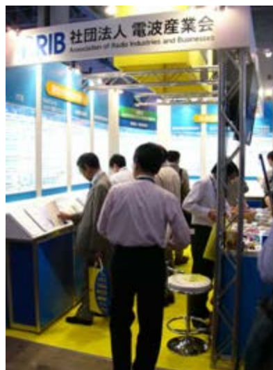
展示資料やパネルの閲覧状況