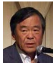
株式会社テレビ東京 島田昌幸代表取締役 社長