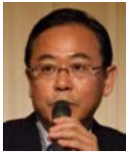
総務省総合通信基 盤局 桜井俊局長