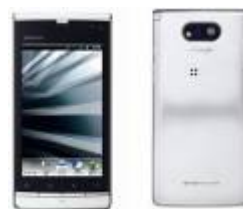
写真4 DIGNO DUAL 「WX04K」

また、2012年夏モデルとして、2012年6月にPHSと3Gのデュアル方式のAndroidスマートフォン「 DIGNO DUAL 」(写真4)を発売しました。DIGNO DUALは、3Gの音声通話に対応しているため、070番号と090/080番号を用途に応じて使用することが可能となっています。