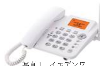
写真1 イエデンワ 「WX02A」

2011 年 11 月には、家庭にある据え置き型のデザインをした電話機「 イエデンワ 」（写真 1）を発売しました。イエデンワは、AC 電源のほかに乾電池でも駆動するため、電源のない場所での通信手段としても活用できるものとなっています。また、プッシュボタンや受話器が大きいので、どなたでも簡単にお使いいただけます。この特長を生かし、全国の教育機関の一部ではイエデンワを設置して通信手段の複数化を図り、災害などの緊急時の連絡手段の確保や地域コミュニティ