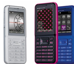
写真3 PORTUS 「WX02S」

PORTUSは、月額基本使用料3,880円(ウィルコムプランW:キャンペーン料金)で、ウィルコムどうしの通話、Eメール、および最大42Mbpsの「ULTRA SPEED」を定額で使うことができます。