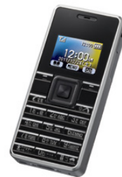
写真2 ストラップフォン 「WX03A」

2012年1月には、ストラップとして取り付けることもできる小さな電話機「 ストラップフォン 」(写真2)を発売しました。ストラップフォンは、PHSの特長である省電力・小型化を活かし、従来の電話機では作り得なかったサイズで、アクセサリ感覚で身につけられる電話機となっています。