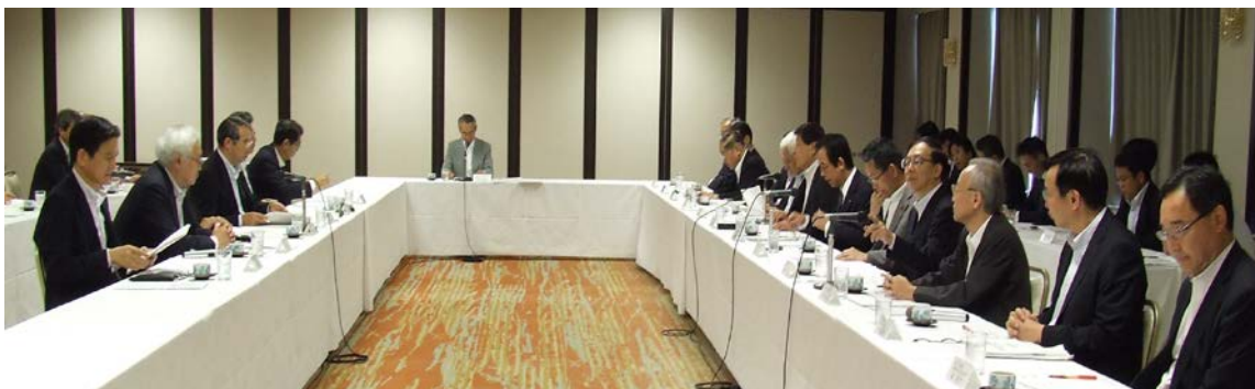
総務省・メーカー社長懇談会の様子