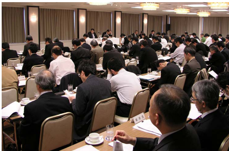
第 86 回規格会議の様子