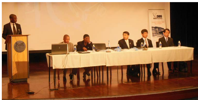
共同作業部会でのモレフィ運輸通信大臣ご挨拶

今後、共同作業部会のもとにワーキンググループを設置して詳細について検討を進め、その結果をもとに第 2 回共同作業部会を開催することとなりました。