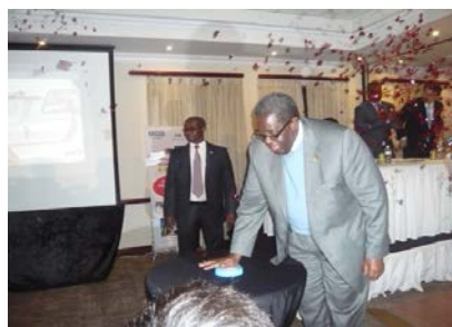
ケディキルウェ副大統領による ”ボタン押し”セレモニー