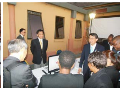
日本企業展示ブース

また、続く 7 月 30 日、31 日にはボツワナと日本との第 1 回共同作業部会が開催されました。