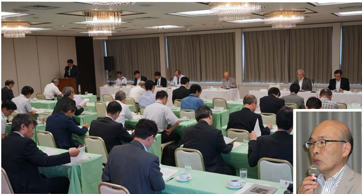
電波環境協議会総会の様子と上 かみ 会長

7 月 1 日（火）、ARIB が事務局を務める電波環境協議会（略称：EMCC）の平成 26 年度総会が、学識経験者、関係省庁、独立行政法人、企業団体等から計 34 名の出席のもと東海大学校友会館で開催されました。