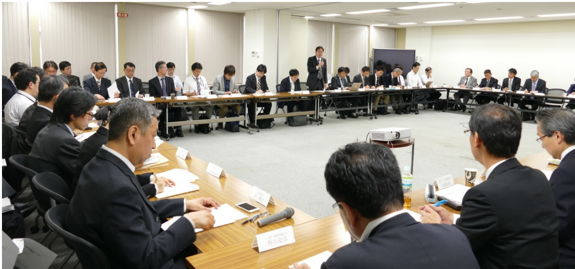
自営無線通信調査研究会第1回会合の様子

本調査研究会は、今後3年間開催予定で、当面は年4回程度の頻度で会合を開催する予定です。次回会合は、本年7月に開催が予定されています。