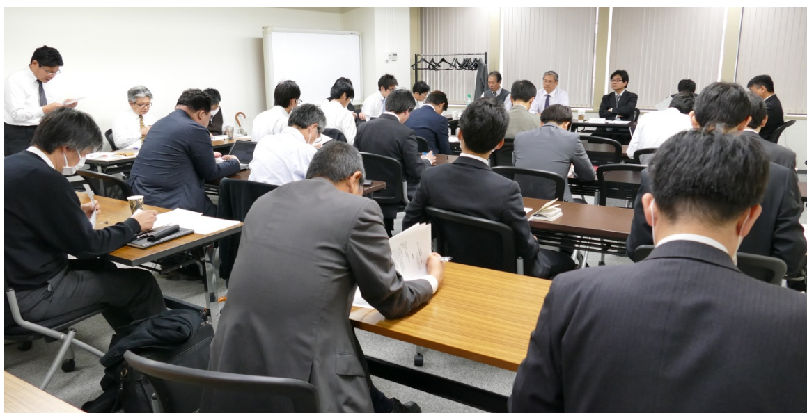
第19回無線LANシステム開発部会の様子